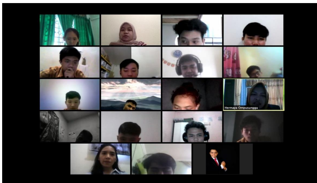
Gambar 1. Pembukaan dan Perkenalan dengan para peserta

Pertemuan pertama dilakukan pada tanggal 3 Oktober 2020. Pada pertemuan ini Ketua (Dosen 1) dan Mahasiswa 1&2 membahas mengenai gambaran umum COVID-19. Saat ini dunia sedang dihadapkan dengan pandemi covid 19, dimana penyebab dari pandemi ini adalah virus corona. Penularan virus ini terjadi melalui udara, dimana media perantaranya adalah tangan dan nafas yang dapat membawa virus ini masuk ke dalam saluran pernafasan. Adapun cara yang dilakukan untuk terhindar dari virus ini, diantaranya adalah: memakai masker, menjaga jarak, dan mencuci tangan. Saat ini sedang digalakkan pemberian vaksin kepada masyarakat, dimana vaksin yang digunakan terdapat dua jenis yaitu Sinovac dan AstraZeneca diharapkan dengan pemberian vaksin ini dapat menekan jumlah penularan virus covid-19.