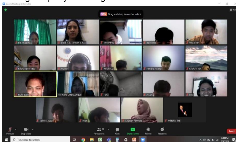
Gambar 4. Photo bersama tim pengabdian dan siswa/siswi

Pertemuan keempat dilakukan pada tanggal 9 Februari 2021. Pada pertemuan ini Dosen 3 dan Mahasiswa 4&5 menyampaikan materi mengenai kelebihan sistem pembelajaran daring. Adapun yang menjadi kelebihan dari sistem pembelajaran daring ini adalah kemampuan siswa terhadap dunia digital bertambah terlebih untuk aplikasi yang digunakan dan tools yang tersedia. Siswa juga merasa memiliki rasa ingin tahu yang tinggi untuk memahami aplikasi yang digunakan dan ketertarikan untuk menu yang ditawarkan. Kemampuan beradaptasi dengan sistem pembelajaran daring sangat diperlukan untuk kondisi saat ini, dimana pemateri juga menyampaikan motivasi kepada para siswa untuk tetap bisa mengikuti pelajaran dengan baik.