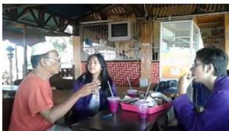
Gambar 6. Kegiatan Pelatihan Informal English Conversation

Simulasi percakapan antara pegawai dan pengunjung dalam Bahasa Inggris merupakan target pelatihan. Peserta mulai mampu mendeskripsikan tentang buah naga walaupun masih banyak kesalahan.