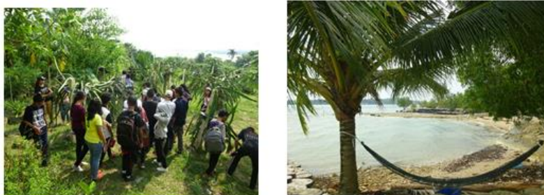
Gambar 1. Keindahan Perkebunan Buah Naga

Perkebunan buah naga adalah tanaman khas yang terdapat di pulau Rempang. Infrastruktur sudah sangat mendukung apalagi dekat dengan ikon Pulau Batam yaitu Jembatan Barelang membuat perkebunan tersebut mudah dijangkau. Dari hasil observasi banyak wisatawan asing yang datang menikmati buah dan melihat perkebunannya. Kafe Zore adalah kafe yang menyediakan jus buah naga dengan pemandangan perkebunan buah naga. Terkadang pengunjung diajak untuk berkeliling di sekitar perkebunan. Banyak yang ingin ditanyakan oleh pengunjung seperti pengunjung dari Jerman tetapi pegawai perkebunan buah naga tidak mampu berkomunikasi dalam Bahasa Inggris ketika berbicara dengan wisatawan asing.