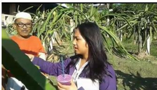
Gambar 7. Simulasi Percakapan di Perkebunan Buah Naga

Menutupi pelatihan ini, tim pengabdian membagikan materi pembelajaran. Diharapkan pegawai bisa belajar mandiri untuk melanjutkan atau mengulang materi pelatihan sehingga pegawai secara aktif dapat melayani pengunjung asing dengan Bahasa Inggris.