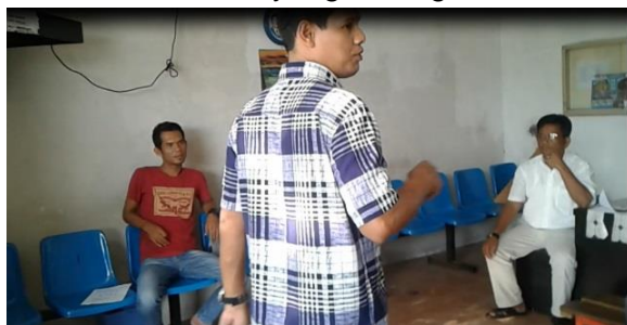
Gambar 8. Simulasi Percakapan di Kafe Zore

Kesinambungan usaha agrowisata perkebunan buah naga tidak lepas dari jumlah pengunjung yang datang. Semakin banyak wisatawan yang datang akan semakin memajukan usaha agrowisata di sekitarnya sebagai imbasnya. Oleh sebab itu para pegawai harus menjaga setiap kata dan perbuatan sehingga tidak menyinggung perasaan tamu-tamu yang datang ke daerah agrowisata.