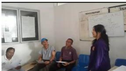
Gambar 5. Kegiatan Pelatihan oleh Mahasiswa-Mahasiswi Prodi Sastra Inggris, Universitas Putera Batam

Pada pembelajaran struktur ( grammar ), peserta kesulitan dalam membuat kalimat sesuai dengan waktu tertentu. Tim pengabdian melatih penggunaan verb be, is, am, are untuk mendeskripsikan benda, menunjukkan benda dan waktu, dan materi dalam bentuk positif, negatif, dan tanya. Peserta diminta mencontohkan kalimat dalam bentuk positif, negatif, dan tanya dengan verb be, is, am, are . Pemberian pelatihan penggunaan do, does, dan did untuk mendeskripsikan kalimat tanya. Tim pengabdian mengajarkan pembentukan kalimat tanya 5-Wh dan 1-H dan peserta diminta untuk membuat contoh kalimat tanya.