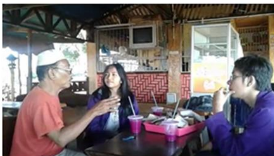
Gambar 2. Anggota Tim Pengabdian diskusi dengan peserta pengabdian

Dari hasil kegiatan wawancara dan observasi, pemilik perkebunan adalah pribadi bukan masyarakat setempat tetapi pegawai kafe dan perkebunan buah naga adalah masyarakat setempat yang memiliki latar belakang pendidikan yang rendah menjadikan mereka memiliki kemampuan komunikasi yang rendah serta kemampuan Bahasa Inggris yang rendah. Pegawai kafe dan perkebunan buah naga mengharapkan kegiatan pembelajaran Bahasa Inggris karena tidak lancar berbahasa Inggris ketika berhadapan dengan wisatawan mancanegara. Ada beberapa alasan yang memengaruhi mereka untuk berbahasa Inggris. Seperti yang disebutkan Ambalegin et al. (2017), kendala dari orang dewasa enggan berbahasa Inggris karena tidak percaya diri, malu, takut salah, dan kurangnya kosakata bahasa Inggris. Pegawai kafe dan perkebunan buah naga setuju bahwa mereka tidak mampu untuk menjawab karena tidak mengerti pada saat mendengar. Mereka sangat ingin belajar Bahasa Inggris diluar waktu jadwal kerja mereka.