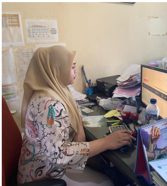
Gambar 2. pengimputan data ke system