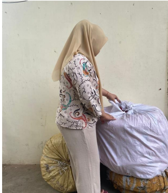
Gambar 3. Stok Barang Yang Tersedia di Gudang.