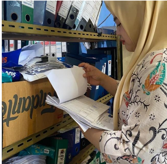
Gambar 1. Pengarsipan Dokumen-Dokumen PT. Swakarsa Berkah Abadi