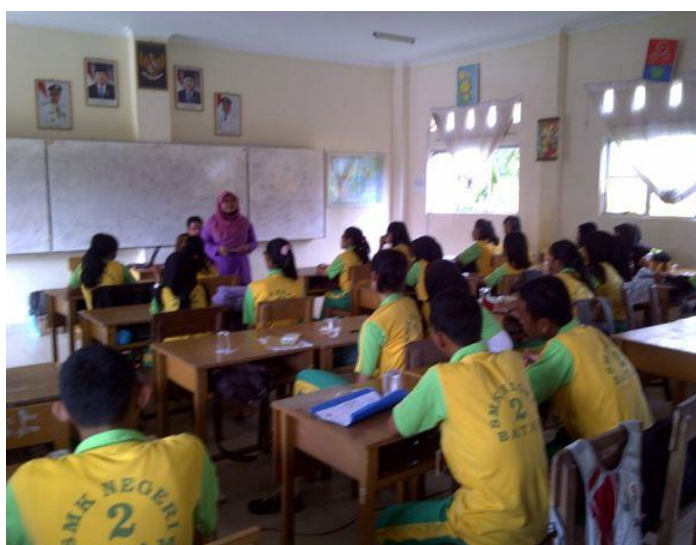
Gambar 2. Pemberian penyuluhan materi tentang tampilan website

Sesi tanya jawab dilakukan, mulai dari pertanyaan tentang bagaimana usaha setiap siswa-siswi mau atau punya keinginan mengetahui tentang teknologi informasi salah satu contoh adalah mempunyai blog gratis.