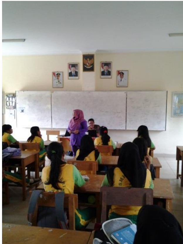
Gambar 3. Sesi tanya jawab mengenai materi tentang berkreasi