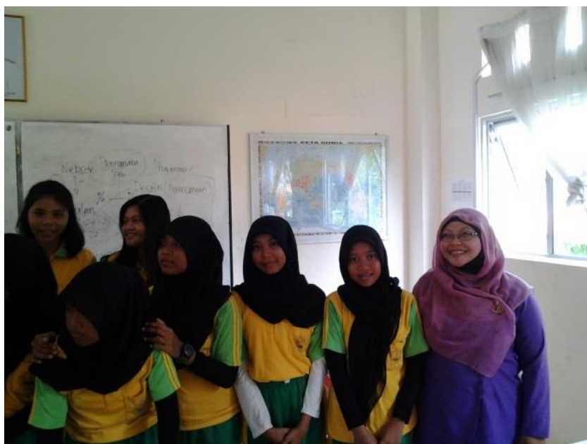
Gambar 6. Foto Bersama siswa/siswi SMK Negeri 2 Batam