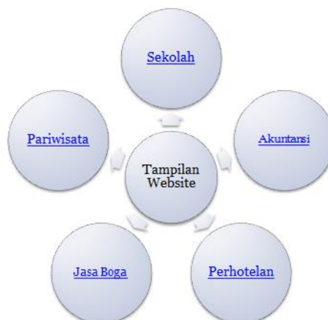
Gambar 11. Beberapa tema tampilan website