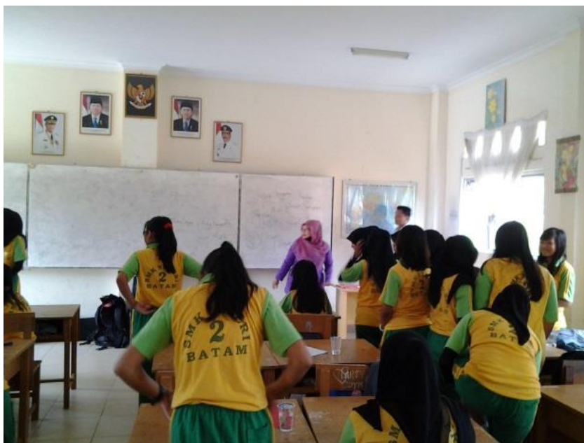
Gambar 5. Persiapan sesi foto bersama

Dengan pengabdian masyarakat ini diharapkan sangat berdampak positif dan benar-benar membantu memberikan pengetahuan tentang berkreasi dengan website yang menarik itu sangatlah mudah.