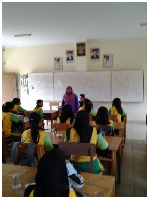
Gambar 4. Sesi tanya jawab mengenai materi tentang tampilan website