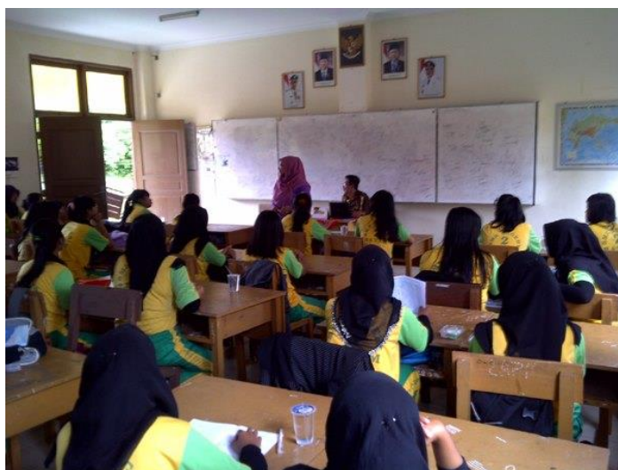
Gambar 1. Pemberian penyuluhan materi tentang berkreasi

Sesi tanya jawab dilakukan, mulai dari pertanyaan tentang bagaimana usaha setiap siswa-siswi mau atau punya keinginan mengetahui tentang teknologi informasi salah satu contoh adalah mempunyai blog gratis.